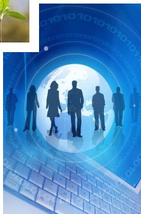
Les développeurs potentiels