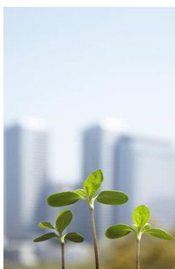
Les « germes » d'activités nouvelles